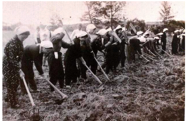
(参考)日本軍とともに飛行場設営に従事する女子挺身勤労隊。宮古島

私は昭和17(1942)年12月に入営し満州ハルピンに送られ、機関銃中隊に配属されました。訓練を経て私は沖縄に移送され宮古島での陣地構築に従事しました。そこでの体験をお話しします。