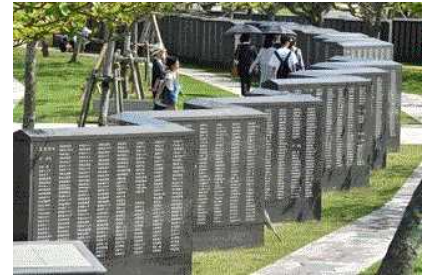
平和の礎(資料映像)

今年6月、国籍や軍人、民間人の区別なく沖縄戦などで亡くなった全ての人々を刻む糸満市摩文仁の「平和の礎」に新たに私の弟2人を含む30人の名前が入った刻銘板が設置されました。